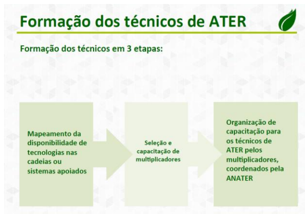
Figura 2: Passos para a formação dos técnicos de ATER/ATES

Metodologicamente, a materialização dessa orientação também pode ser encontrada no documento de lançamento da ANATER. A Figura 2 apresenta a concepção da ANATER para a capacitação dos extensionistas baseada na identificação de tecnologias disponíveis, capacitação de multiplicadores que, por sua vez, capacitarão os técnicos de ATER nas tecnologias disponíveis.