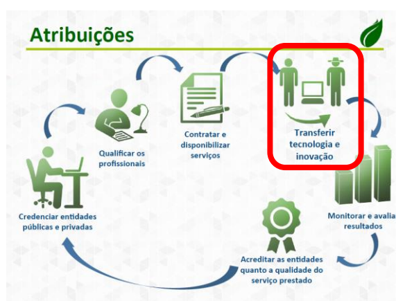
Figura 1: Atribuições da ANATER Fonte: BRASIL (2013)

Através desse formato a possibilidade de participação e controle social da Agência é restrita e não garante a estabilidade dos serviços frente às mudanças nas gestões governamentais. Além de ser um espaço pouco representativo, o Conselho não tem caráter deliberativo, apenas propositivo. Igualmente, o Decreto de criação da ANATER não prevê espaços locais e regionais de discussão e deliberação sobre os rumos dos serviços de extensão rural. A orientação para os serviços de ER não é claramente apresentada na Lei e no Decreto, mas na apresentação de lançamento da Agência (em dezembro de 2013) a referência à transferência de tecnologia é explícita, como mostra a Figura 1.